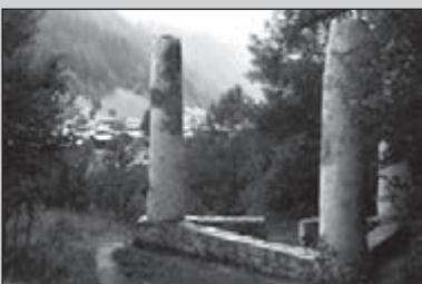
Cultuur opsnuiven in de Goms

De ochtend na het feest in Nijnsel kon een mooie wandeling gemaakt worden in helaas niet al te best weer